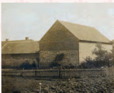
Stodola č.p. 160 před přestavbou na RD č. 263