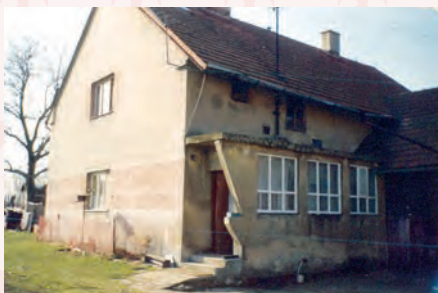
č.p. 263 po přestavbě