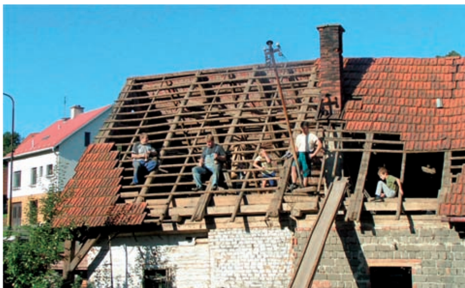
Chalupa č. 41 se začíná bourat