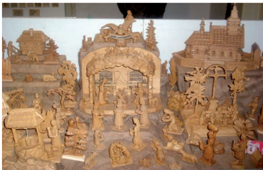
Betlém p. Josefa Matouše ze Sebranic