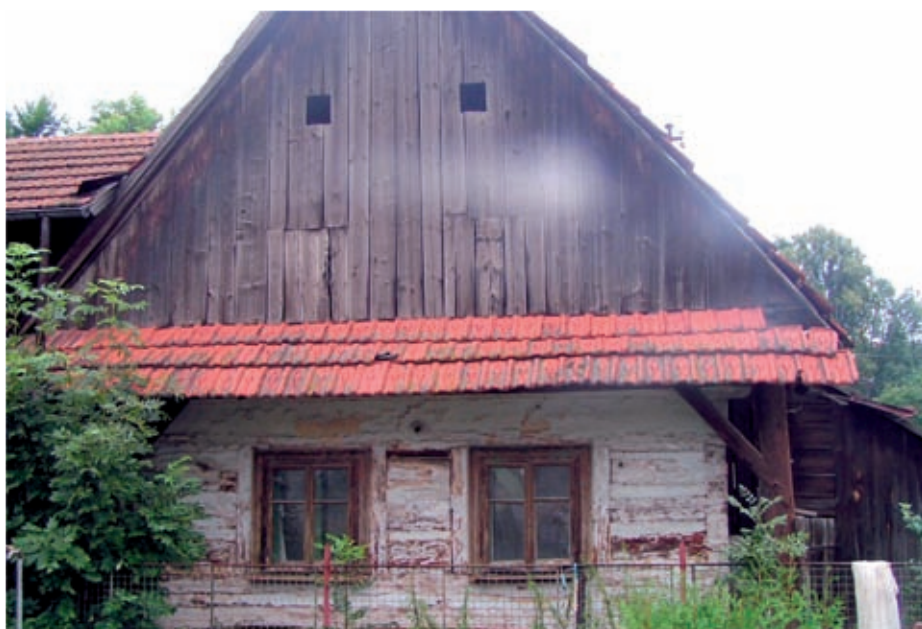
Roubená část chalupy