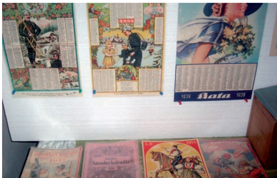
Z vánoční výstavy